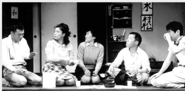
2004年初演より

電化製品が普及し始めた1960年代。手作業でもやしを生産している「泉商店」の長男恵五郎は、妻に先立たれ一人で息子を育てながら、寝る暇もなくもやしを作り続けていた。妹の十子と弟の一彦は、自分の事ばかりで店を全く手伝おうとせず、ある日、ふらりと現れたもやしっ子のような青年を住み込みで雇うことになる。家族や周囲の人々との心通う交流を懐かしく描き出した、小川未玲の珠玉作です。